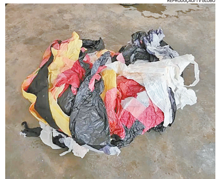
Balão foi apreendido pelos agentes da Polícia Civil em operação

Em parceria com a DPMA, o Corpo de Bombeiros lançou a campanha “Balão Mata”, contra as atividades envolvendo o artefato. As denúncias podem ser feitas pelo Linha Verde nos telefones 0300 253 1177, pelo WhatsApp (21) 2253-1177, ou no aplicativo Disque Denúncia RJ.